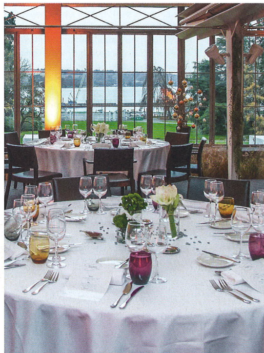
Neuer Eventort: Der Wintergarten des Parc des Eaux-Vives.

Und nächstes Jahr wird die Westschweizer Metro-pole dank Roger Federer ein weiteres Mal im Glanzlicht stehen. Der vom «Maestro» mitinitiierte Laver Cup findet kommenden September in den Palexpo-Hallen statt. Erwartet werden 20000 Besucher. Die Balance finden zwischen Business, Savoir-vivre , Events und Entdeckerlust? In Genf wahrlich keine Herausforderung.