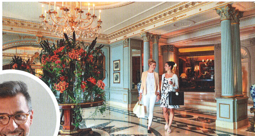
An Luxushotels fehlt es in Genf nicht – an tieferen Kategorien schon.

Sicherheit und Stabilität sind Kernelemente. Die zentral gelegenen Anlaufstellen und Plattformen in Gehdistanz sind weitere Pluspunkte. Und die ausgewogene Balance zwi-