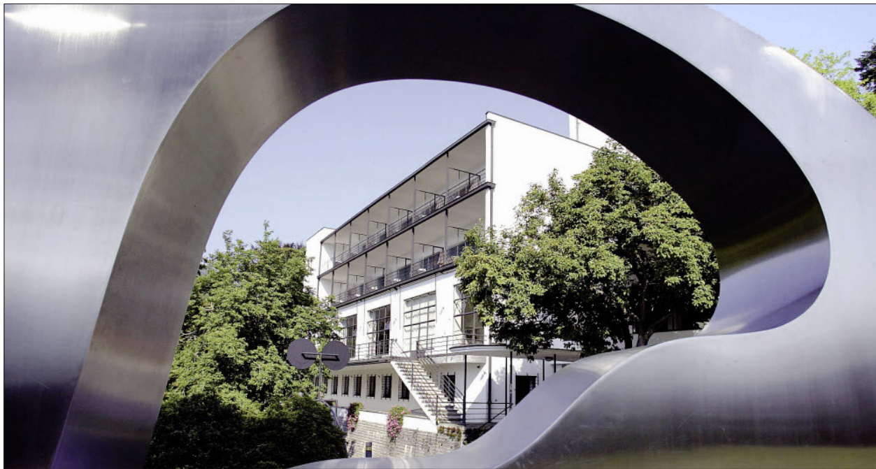
Blick auf das Hotel Monte Verità, wo neu auch Individualgäste Ferien verbringen können.

Ascona Locarno. Konzepte. Das Hotel Monte Verità lockt mit seinen Zimmern im Bauhausstil und seiner Lage an einem Kraftort Ruhe suchende Gäste. Im Restaurant Seven in Ascona treffen sich urbane trendige Geniesser.