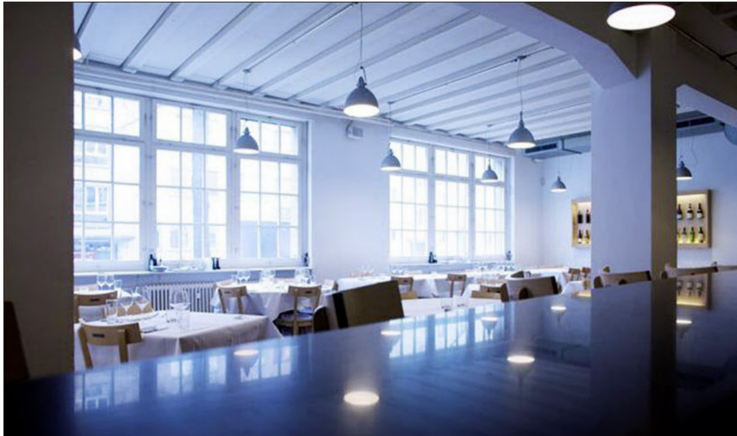
Atmosphärische Wine Loft: Entspannt, stilvoll, beschwingt. Vorn die 18 Meter lange Bartheke, hinten die Esstische, das Ganze in einer Fabrik.

Gastroszene Zürich. Institutionen. Sie sind von Zürich nicht mehr wegzudenken: allen voran die Kronenhalle, die Heimat vieler Alteingesessener. Neuer, aber bereits verankert, sind «Caduff's Weinloft» und das «Kaufleuten».