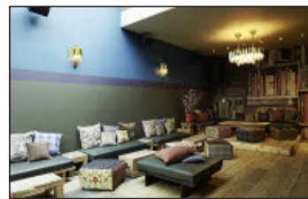
Trendige Gemütlichkeit: Hier lässt sich gut verweilen.

Wohl ein weiser Entscheid, denn viele Gäste essen im «Kaufleuten» auch (oder nur) der guten Salatsauce wegen. Es stehen auch trendige Gerichte auf der Karte: «Wir waren das erste nicht japanische Restaurant in Zürich, das Sushi serviert hat.»