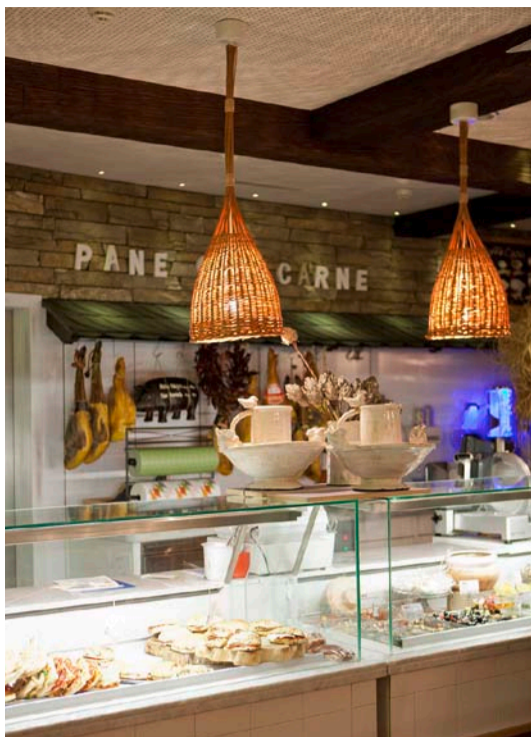
Das «Pane con Carne» ist eine gelungene Mischung aus Detailhandel und Gastronomie.