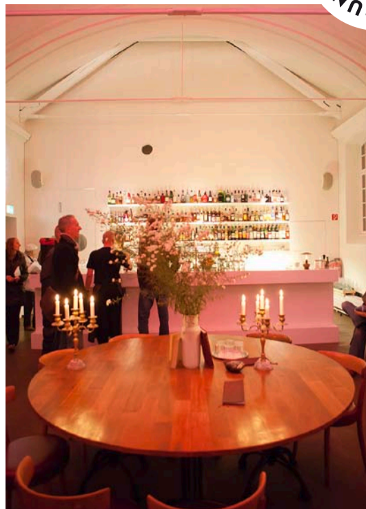
Das «Caffè zum Kuss» ist erst seit wenigen Wochen offen und belebt den Elisabethenpark nahe dem Bahnhof Basel SBB neu.